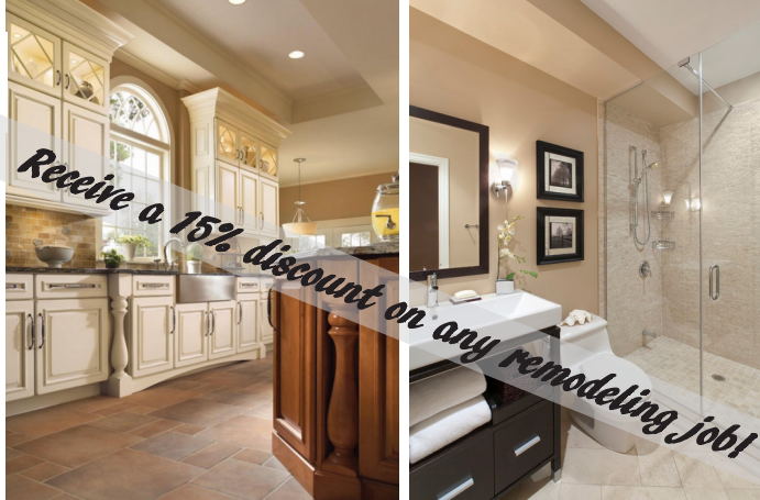
Painting & Services Unlimited Lic. CC94BS00437 • Lasora Enterprises, Inc CGC031497 Licensed & Insured General Contractor